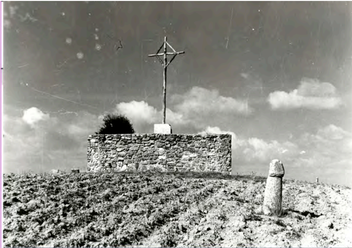
Vista panorámica del vía crucis con falos y sin cruces. Distribución anterior a la actual