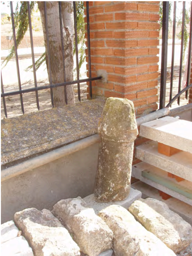
Falo procedente de la ermita de las tres culturas y guardado en una nave del ayuntamiento