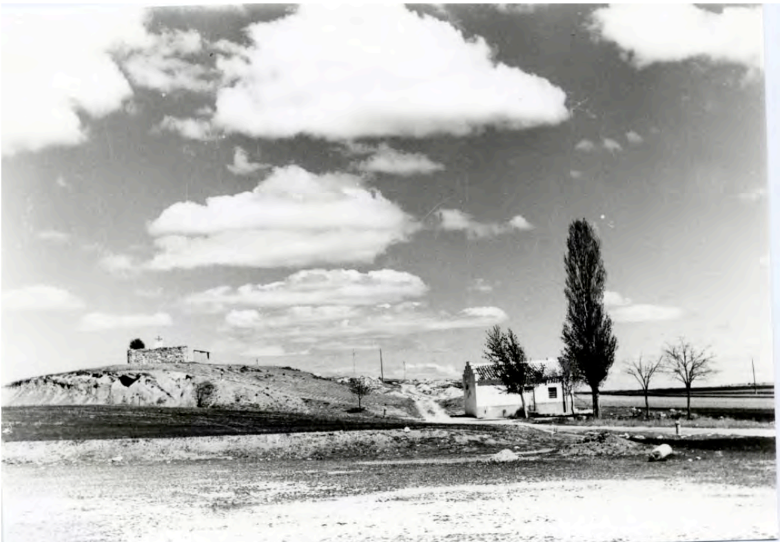
Vista panorámica del vía crucis con falos y cruces. Distribución de los falos anterior a la actual