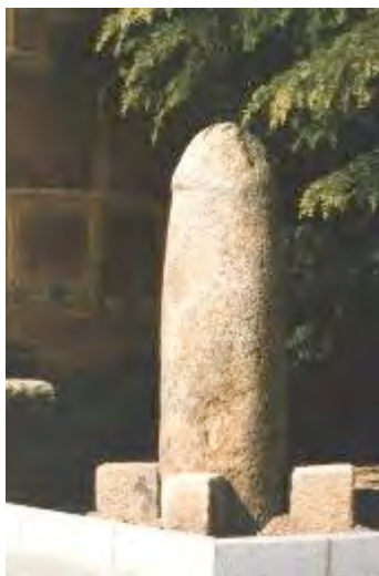
Falo romano de Rabanales junto a la iglesia

Los falos hallados en la península ibérica consideramos que son de origen romano. Romanos son los falos de Ufones y Rabanales (Zamora), donde se han hallado diversos restos romanos y castros celtas. En Rabanales existen dos falos al lado de la iglesia, uno mayor que otro, el mayor de ellos tiene unos dos metros de altura. El de Ufones es de menores dimensiones y también se halla junto a la iglesia, lo cual nos hace pensar en que recibirían culto, pues es sabido que los cristianos levantaron sus templos en los mismos lugares donde antes se había practicado un culto pagano.