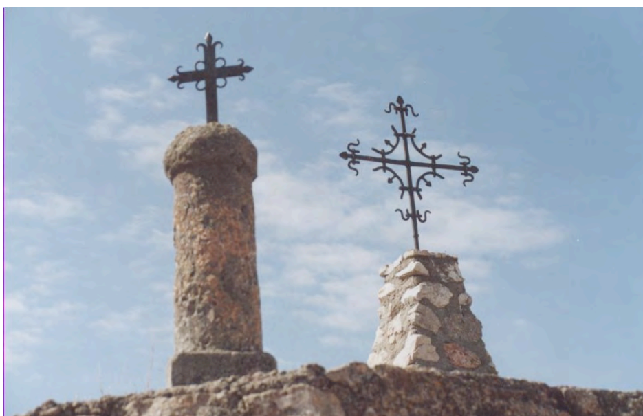
Tercer falo del calvario