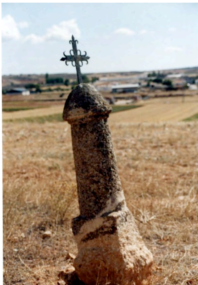
Falo situado actualmente delante del calvario