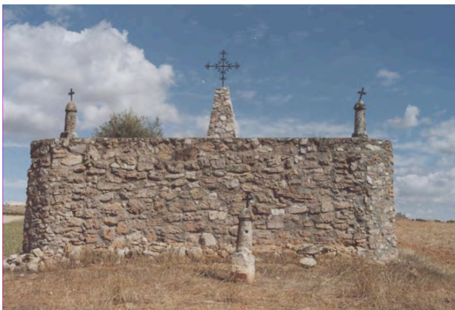
Vistas panorámicas del calvario con los falos. Situación actual