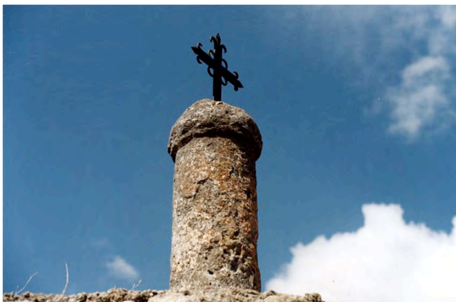
Primero de los cuatro falos del calvario