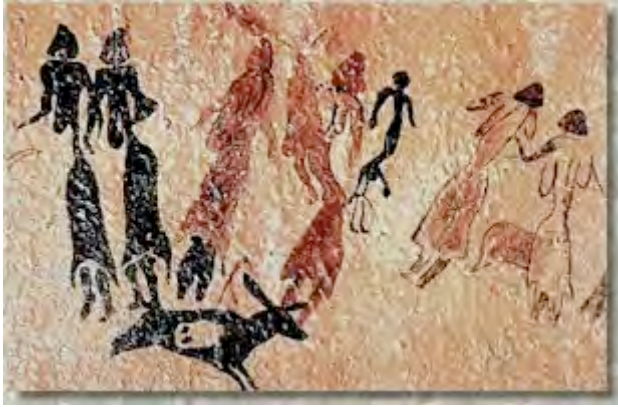
Pintura rupestre de Cogull

Una de las probables interpretaciones del uso y significado de los menhires ( men = piedra e hir = larga) es que sean monumentos a los dioses para lograr de ellos fecundidad y fertilidad, pues el menhir sería un símbolo fálico que representaría al falo, siempre erecto, del dios creador del mundo. Los menhires no sólo los encontramos en la cultura europea, sino también en la americana. Así, por ejemplo, en la localidad del Mollar, provincia de Tucuman (Argentina), se ha creado un parque arqueológico con los menhires hallados en las inmediaciones, menhires que también encontramos en Perú, Nicaragua, México o la isla de Pascua. En algunos menhires hay grabadas serpientes, animales que también se asocian a la fertilidad o círculos concéntricos que simbolizan el yoní hindú o la vagina, que a su vez simboliza la fertilidad.