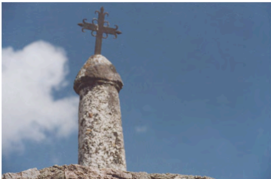
Segundo falo del calvario