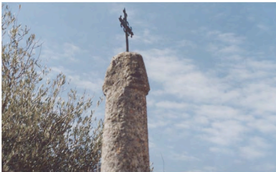
Cuarto falo del calvario que formaba parte del vía crucis campestre