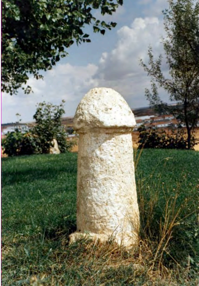
Falo final de vía crucis. Actualmente ubicado en una finca particular